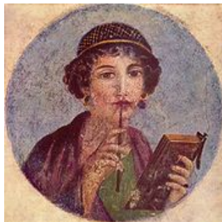
Mädchen mit Wachstafelbuch und Stilus (Herculaneum, um 50)

Charakteristisch für röm. Erziehung ist die Anschauung, dass die Kindheit keine eigenständige Epoche sei. Das Kind wird wie ein „kleiner Erwachsener“ betrachtet. Jede pädagogische Maßnahme diene daher nur der Überwindung dieser Phase und der reibungslosen Anpassung an die Welt der Erwachsenen.